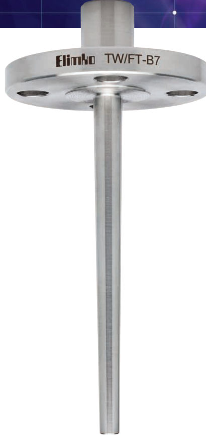
TW/FT Flanşlı Tip Konik Thermowell