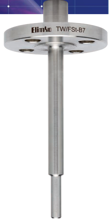
TW/FSt Flanşlı Tip Kademeli Thermowell