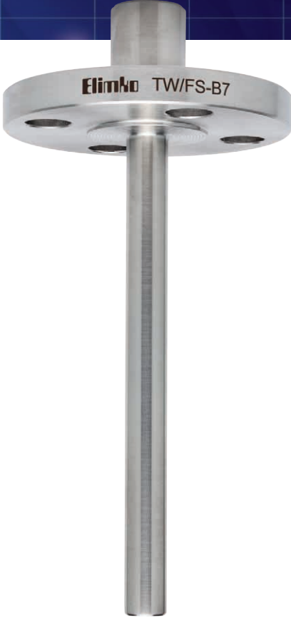
TW/FS Flanşlı Tip Düz Thermowell